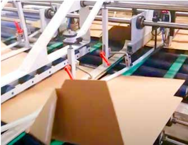
Automatikboden (Crash Lock) Verarbeitung